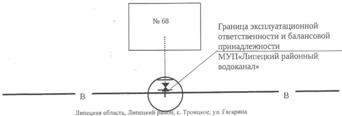
Схема разграничения балансовой принадлежности и эксплуатационной ответственности по водопроводным сетям

водопроводная сеть МУП «Липецкий районный водоканал» - сплошная линия водопроводная сеть абонента - пунктирная линия.