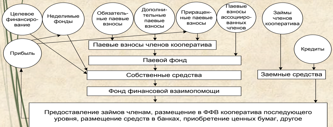
Схема формирования фонда финансовой взаимопомощи

В СКПК должен быть создан фонд финансовой взаимопомощи , который является источником займов, предоставляемых членам кредитного кооператива.